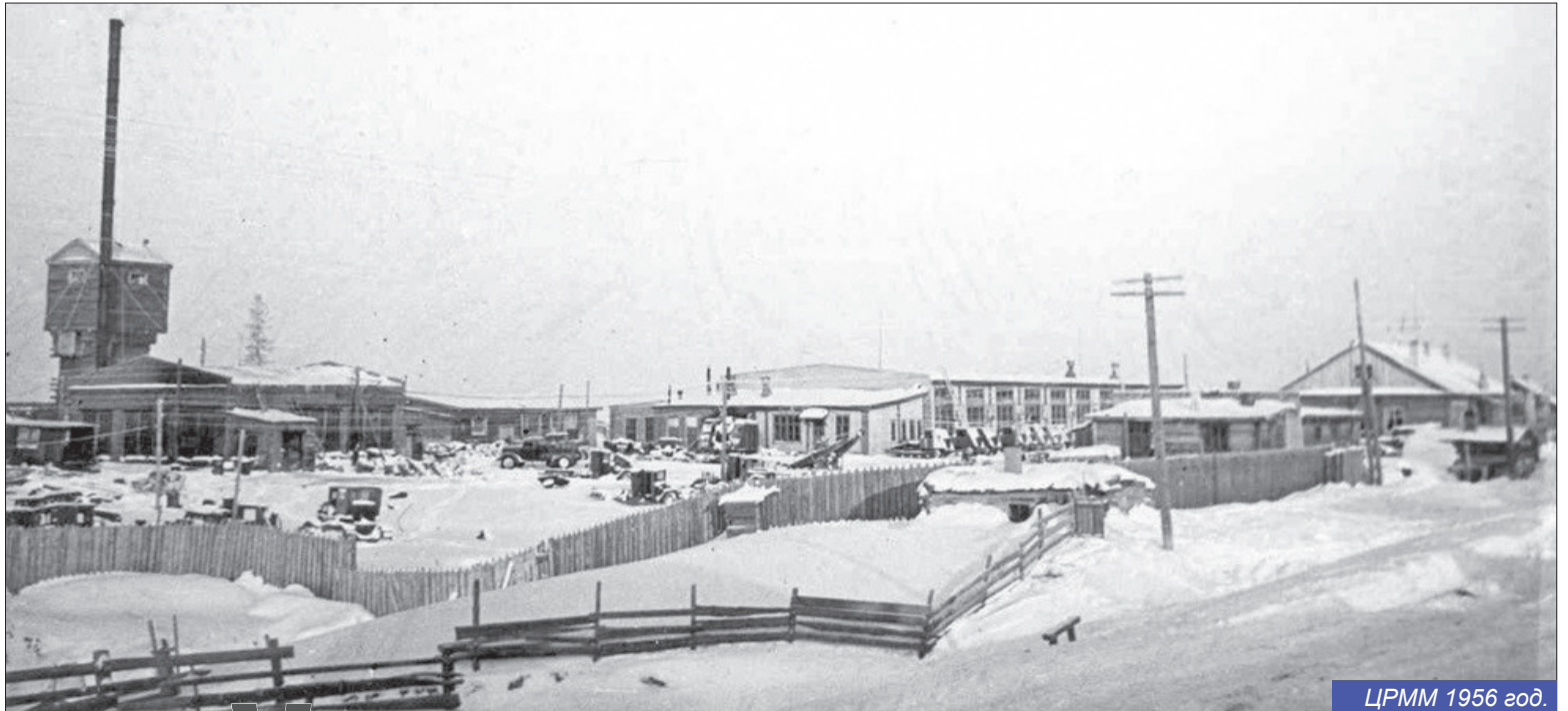
ЦРММ 1956 год.