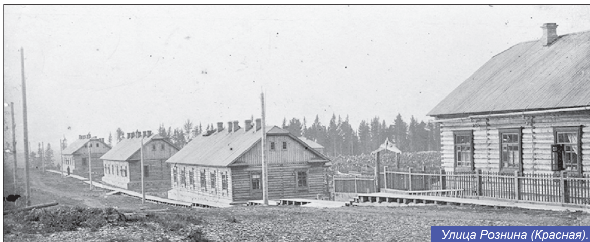
Улица Рознина (Красная).

В 1951 году был образован Ханты-Мансийский стройучасток треста «Сиблестрансстрой», а в 1953 году созданы Центральные ремонтно-механические мастерские комбината «Тюменьлес». В 1969-1970 году прошел ряд преобразований и предприятие стало именоваться районным объединением «Сельхозтехника», а с 1986-го - Ханты-Мансийским ремонтно-техническим предприятием Агропрома. В 1995 году было преобразовано в МУП по ремонту и техническому обслуживанию