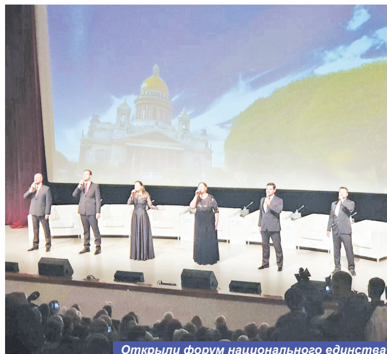
Открыли форум национального единства

ная дата неизвестна. Если кто-то заинтересовался, смотрите в социальных сетях страницу «Октябрь», у «Солистов Югры» есть и своя страница. Присоединяйтесь, мы будем счастливы. Там же сможете узнать обо всех предстоящих концертах.