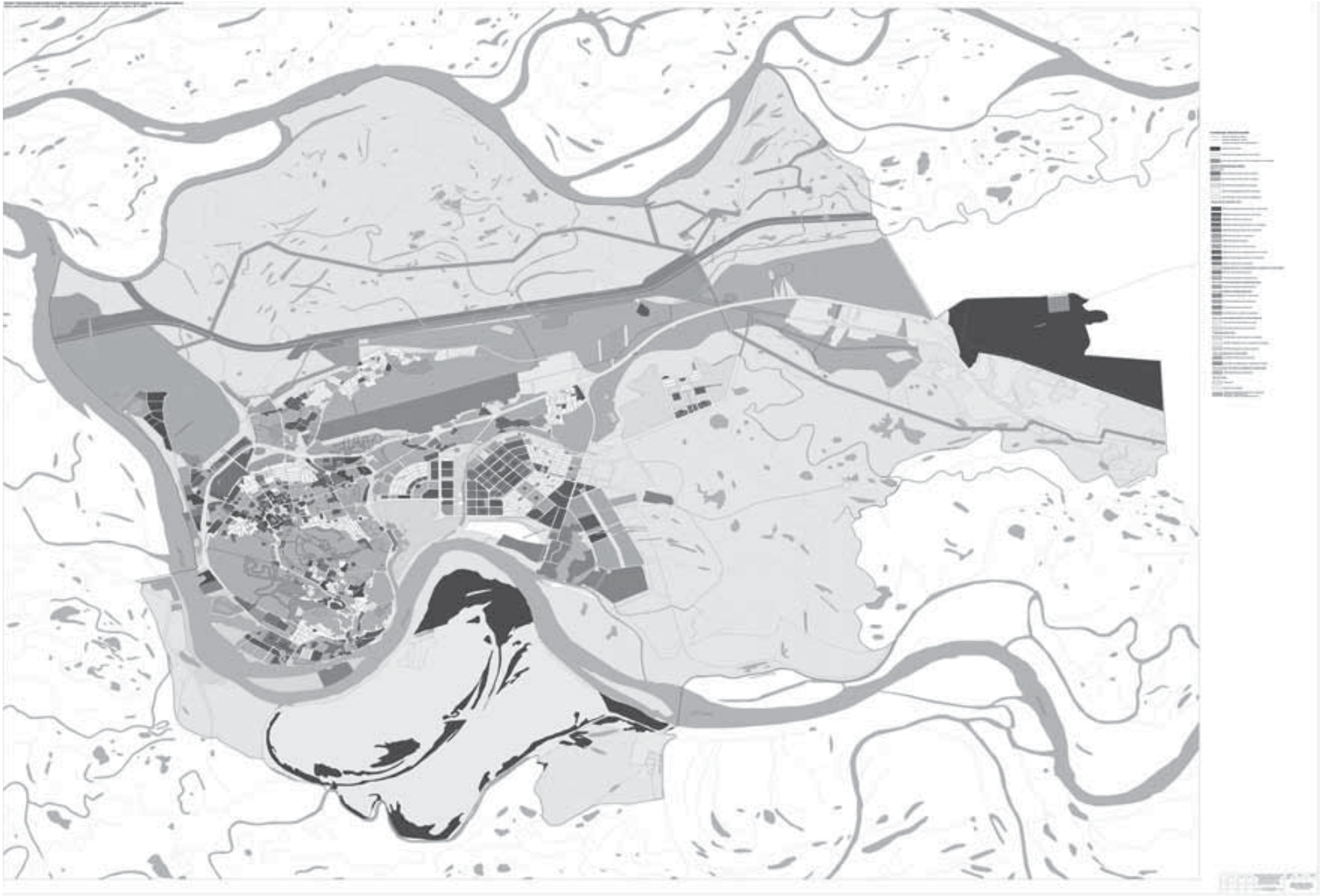
Карта градостроительного зонирования. Границы территориальных зон городского округа, М 1:10000