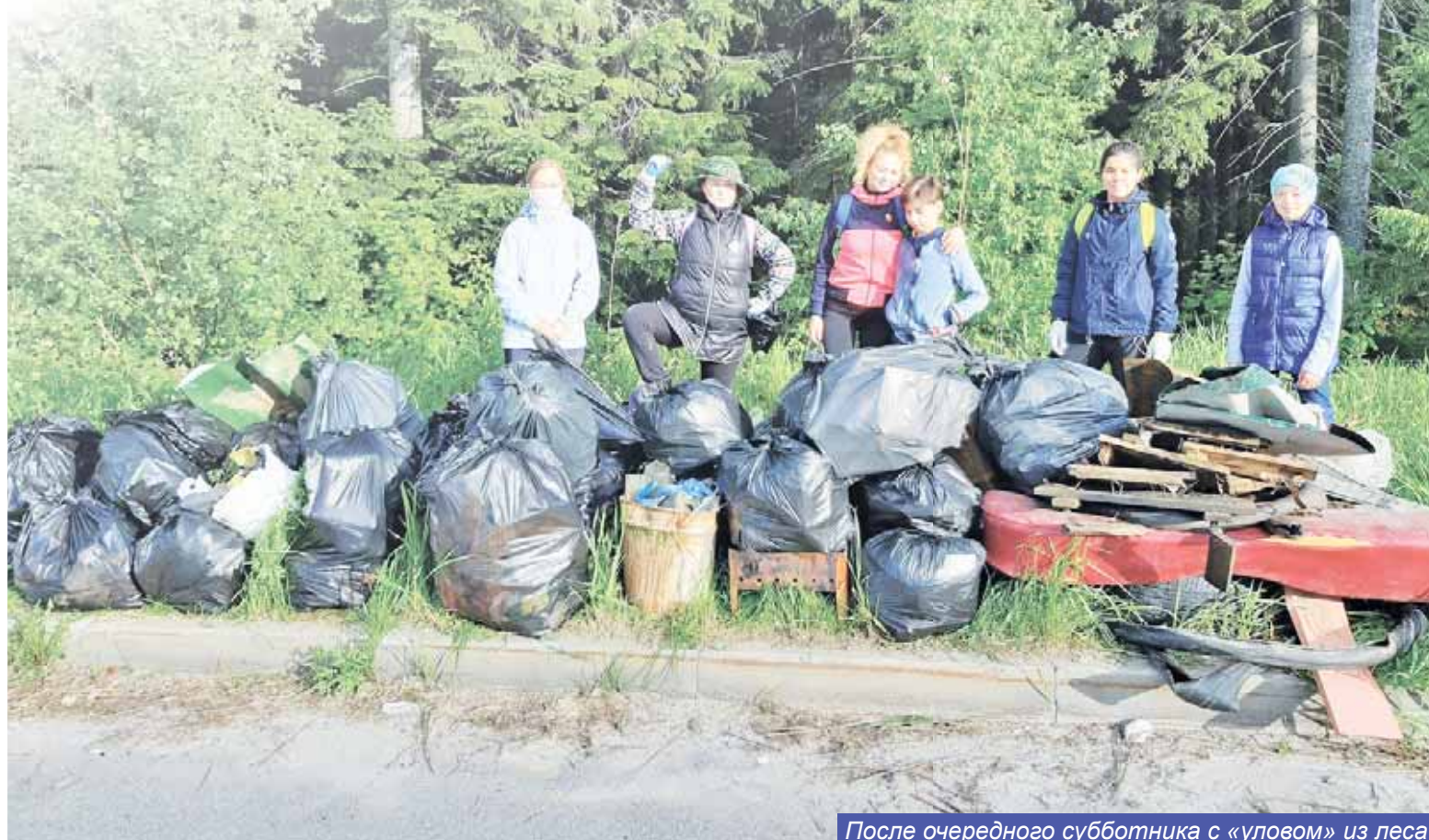
После очередного субботника с «уловом» из леса

Приятно наблюдать, что число хантымансийцев, желающих