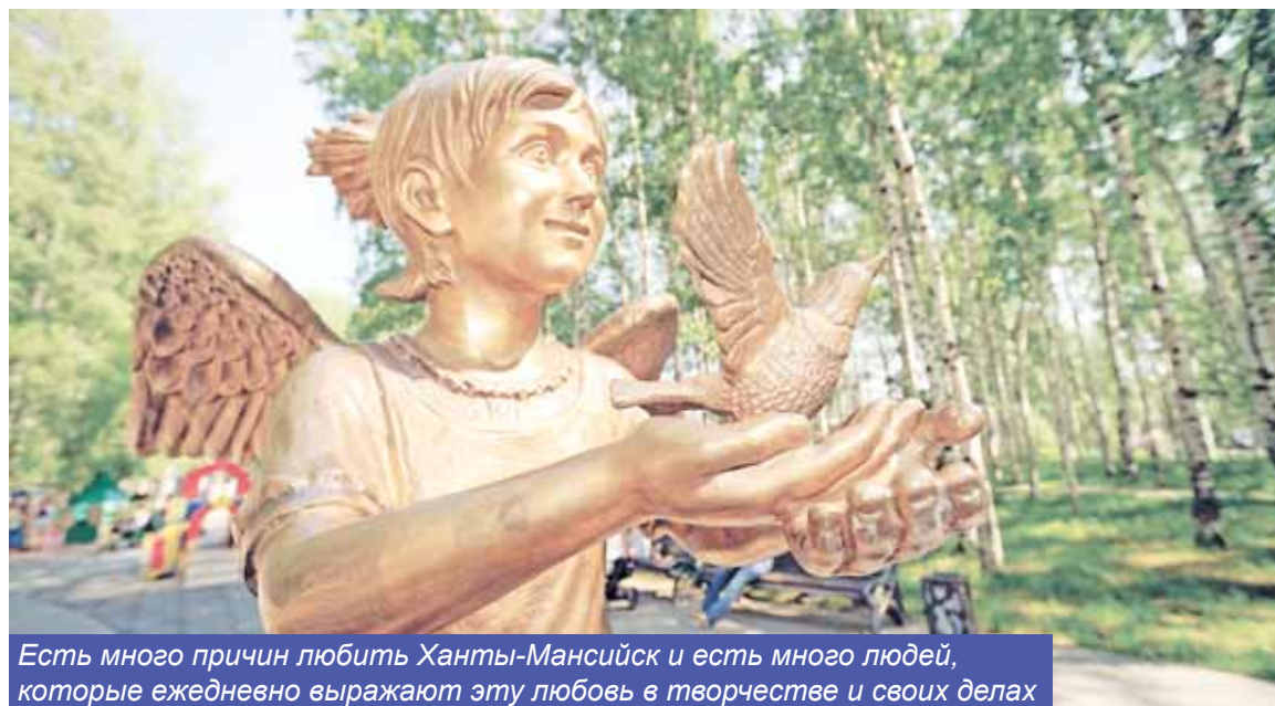
Есть много причин любить Ханты-Мансийск и есть много людей, которые ежедневно выражают эту любовь в творчестве и своих делах

свой город? И вот что услышал от своих земляков: