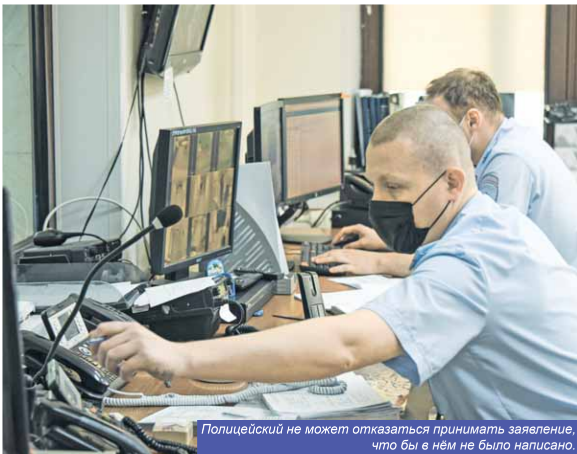
Полицейский не может отказаться принимать заявление, что бы в нём не было написано.

Как правило, правоохранительные органы должны принять законные меры по обращению гражданина в срок от трех до 30 дней. Это зависит от сложности дела. Время проверки увеличивается, если, например, необходимо собрать какие-либо справки, опросить свидетелей, провести судебно-медицинскую экспертизу.