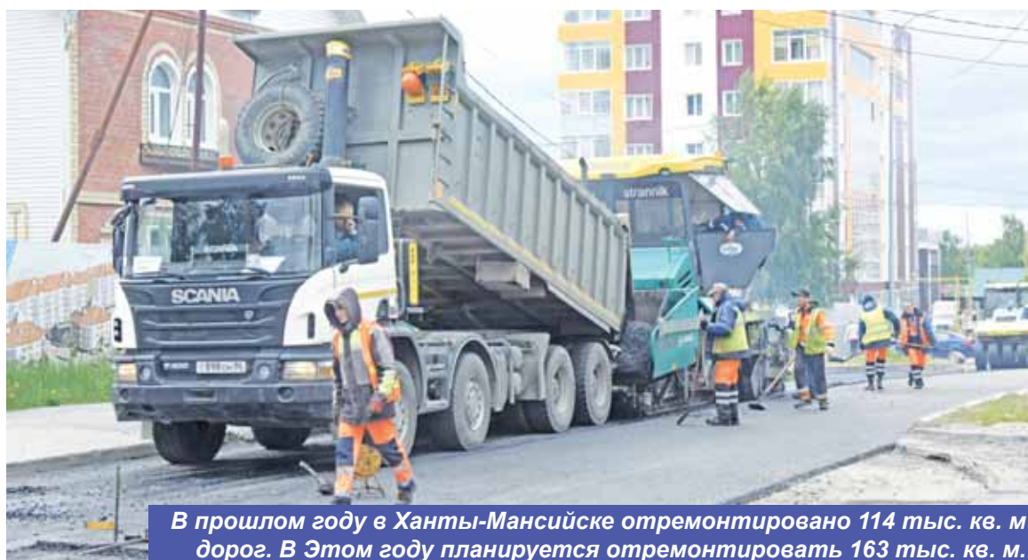
В прошлом году в Ханты-Мансийске отремонтировано 114 тыс. кв. м дорог. В этом году планируется отремонтировать 163 тыс. кв. м.

Построена автомобильная дорога с транспортными развязками от ул. Дзержинского до ул. Объездная, проводились реконструкция автомобильной дороги по ул. Тихая и строительство улиц и дорог (второй этап) в жилом комплексе «Иртыш».