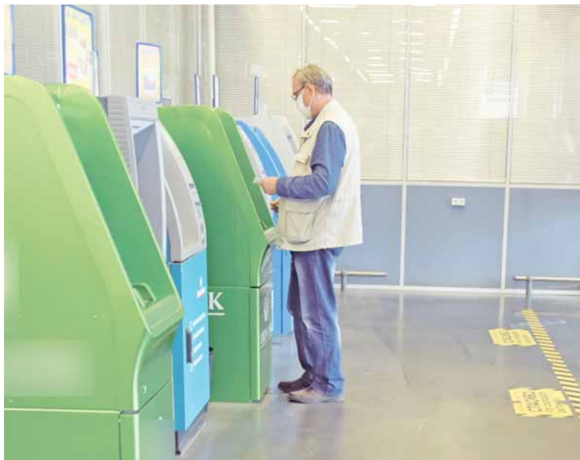
Банкомат тоже может стать средством совершения преступления, если вы совершаете манипуляции со своим счетом под диктовку постороннего человека

Что тут скажешь? Внимательность. Спокойствие. Информаци-