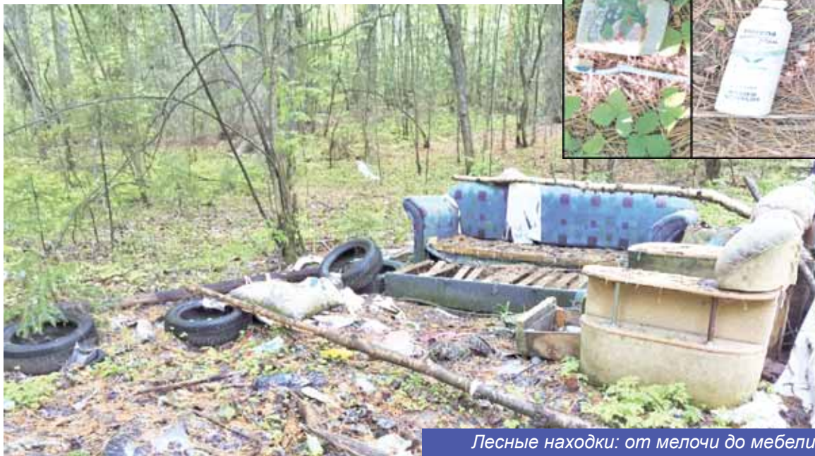
Лесные находки: от мелочи до мебели