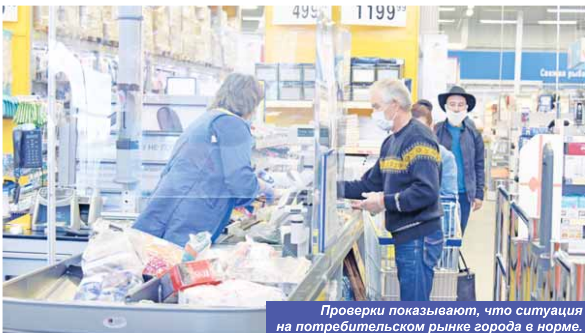
Проверки показывают, что ситуация на потребительском рынке города в норме.

В Ханты-Мансийске в ежедневном режиме ведется мониторинг складских запасов и цен на продукты и товары первой необходимости.