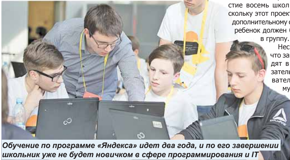
Обучение по программе «Яндекса» идет два года, и по его завершении школьник уже не будет новичком в сфере программирования и IT

Второй этап – собеседование, которое пройдет в режиме