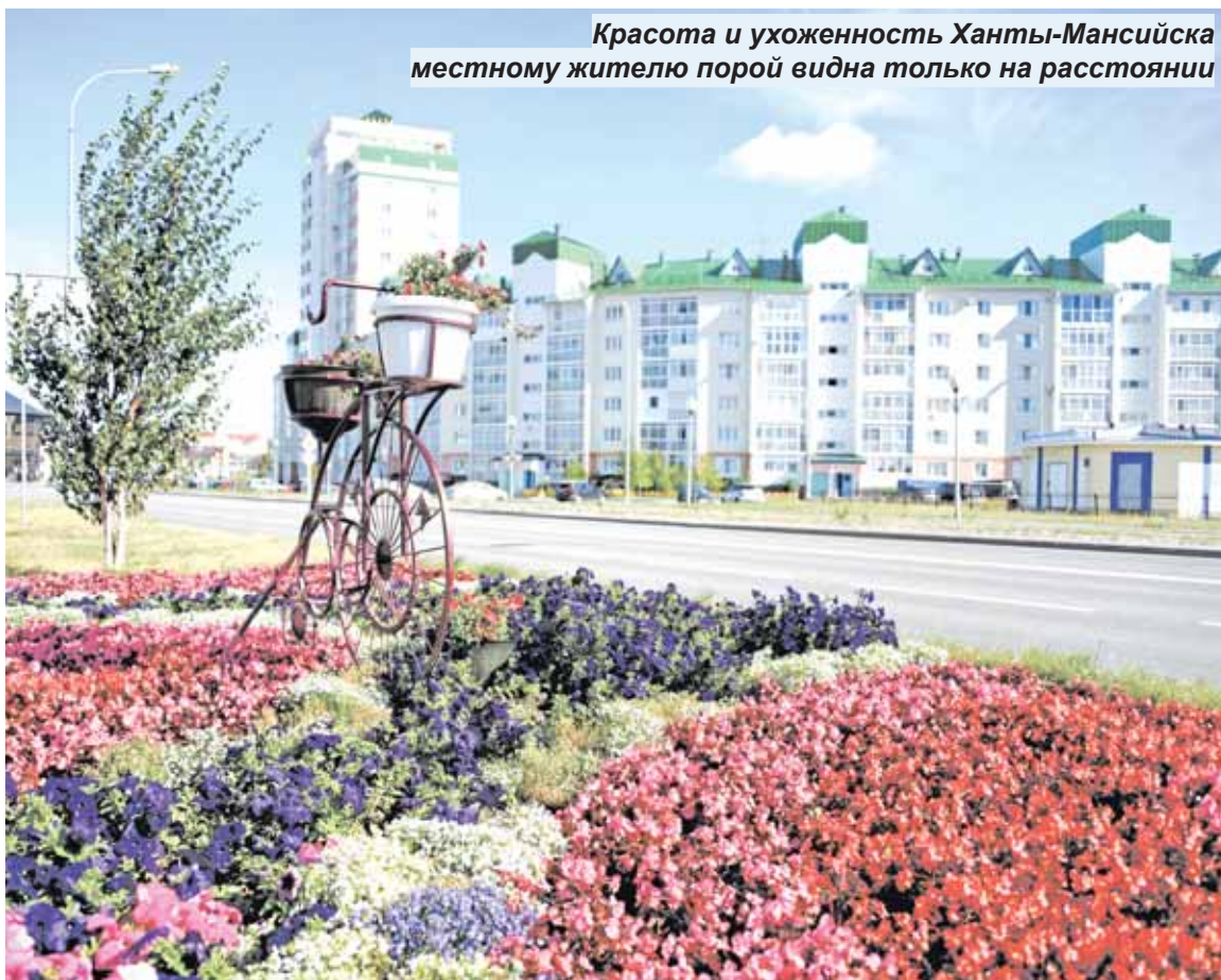
Красота и ухоженность Ханты-Мансийска местному жителю порой видна только на расстоянии

Я, видимо, городской, что уж говорить, житель, поскольку удивилась, как много людей в нашей стране живет в частных домах, как крепка «сельскохозяйственная» природа русского человека. Мне казалось, что мы будем ехать так: дорога-дорога-дорога, потом город и высоты, снова дорога-дорога, город и высоты. Оказалось, совсем не так: мы едем, а вокруг – дома, дома, дома... Большие, маленькие, старые, новые, совсем покосившиеся, заброшенные и просто какие-то дворцы! Есть такие странные деревеньки: в трех домах идет жизнь, это заметно, остальные дома разрушаются. Что там делают люди в