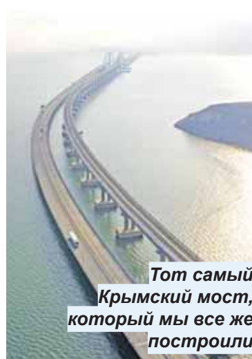
Тот самый Крымский мост, который мы все же построили

Крым, который год весь погружен в дорожное строительство и вообще в строительство. На глазах сельско-деревенский ландшафт (я имею в виду именно инфраструктуру, не горы, море и