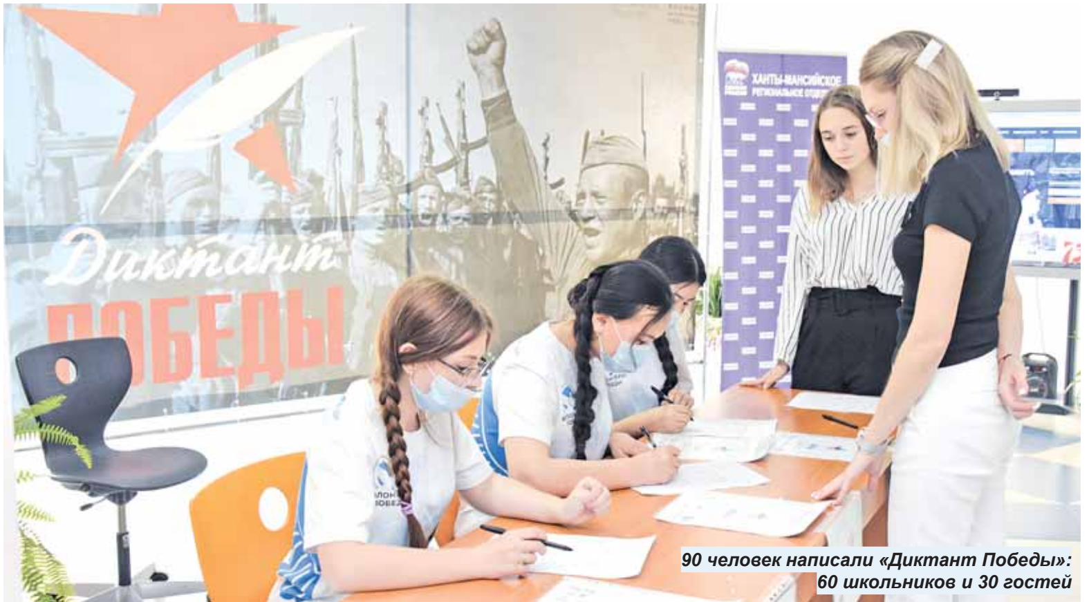
90 человек написали «Диктант Победы»: 60 школьников и 30 гостей

«По инициативе партии «Единая Россия», по всей стране, в том числе и у нас в регионе проходит просветительско-патриотическая акция «Диктант Победы». За четыре года войны можно отметить много примеров доблести и героизма, которые стали образцом для следующих поколений. И основная задача «Диктанта Победы» – донести в