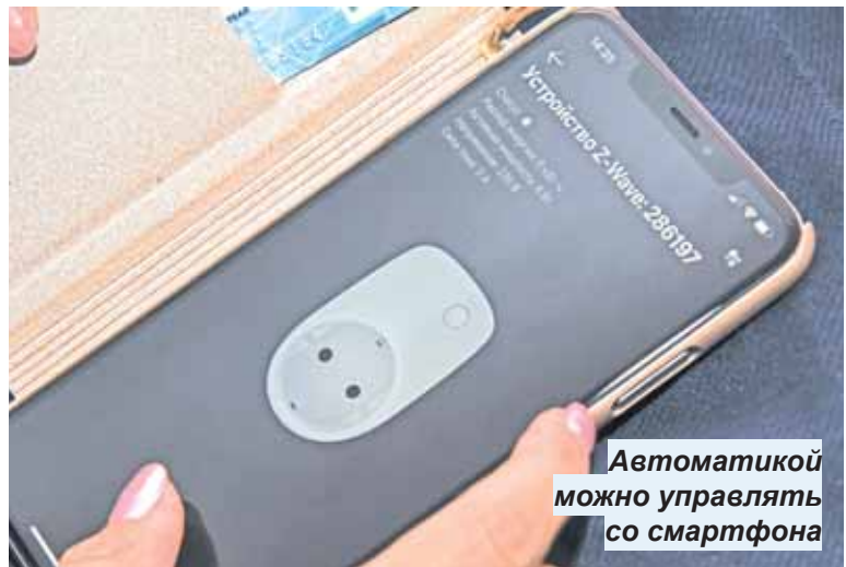
Автоматикой можно управлять со смартфона