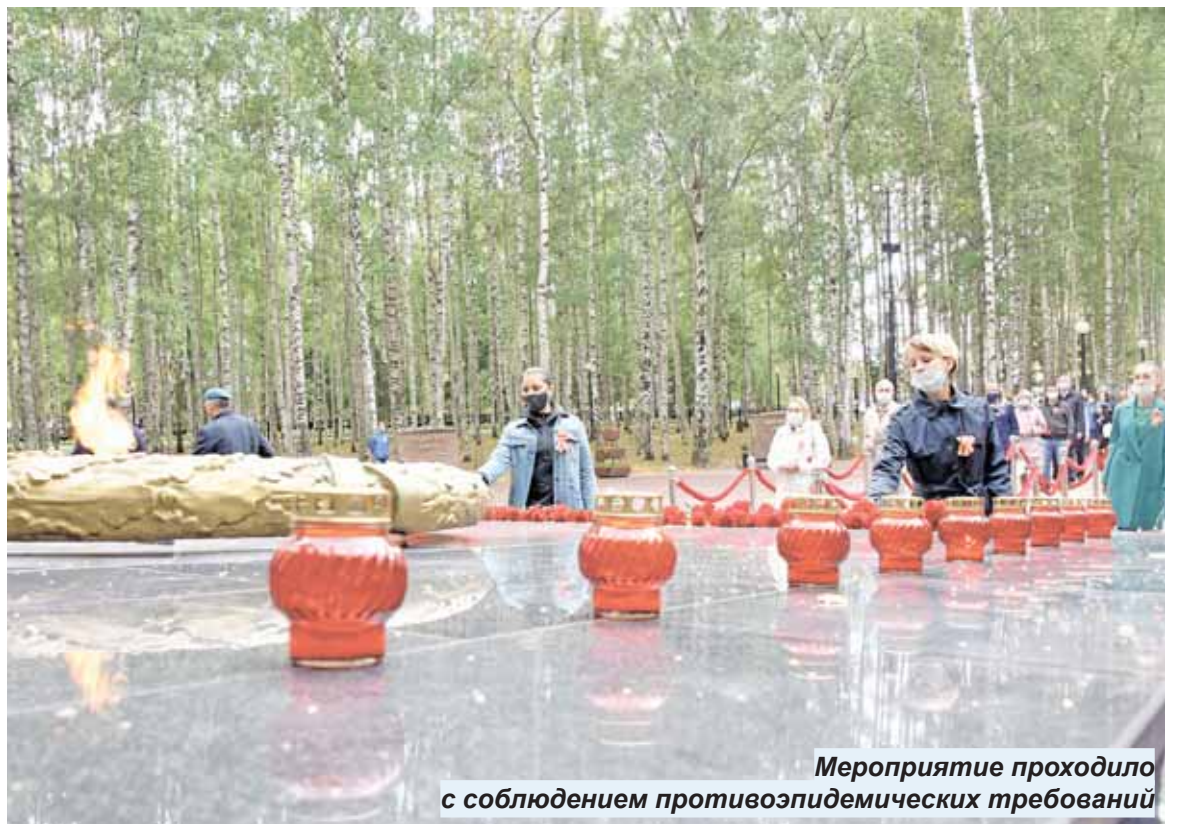
Мероприятие проходило с соблюдением противоэпидемических требований