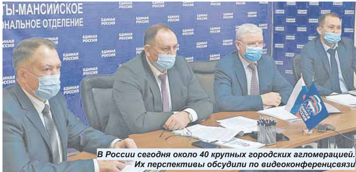
В России сегодня около 40 крупных городских агломераций. Их перспективы обсудили по видеоконференцсвязи

С приветственными словами в адрес участников заседания также обратились Председатель комитета Совета Федерации по фе-