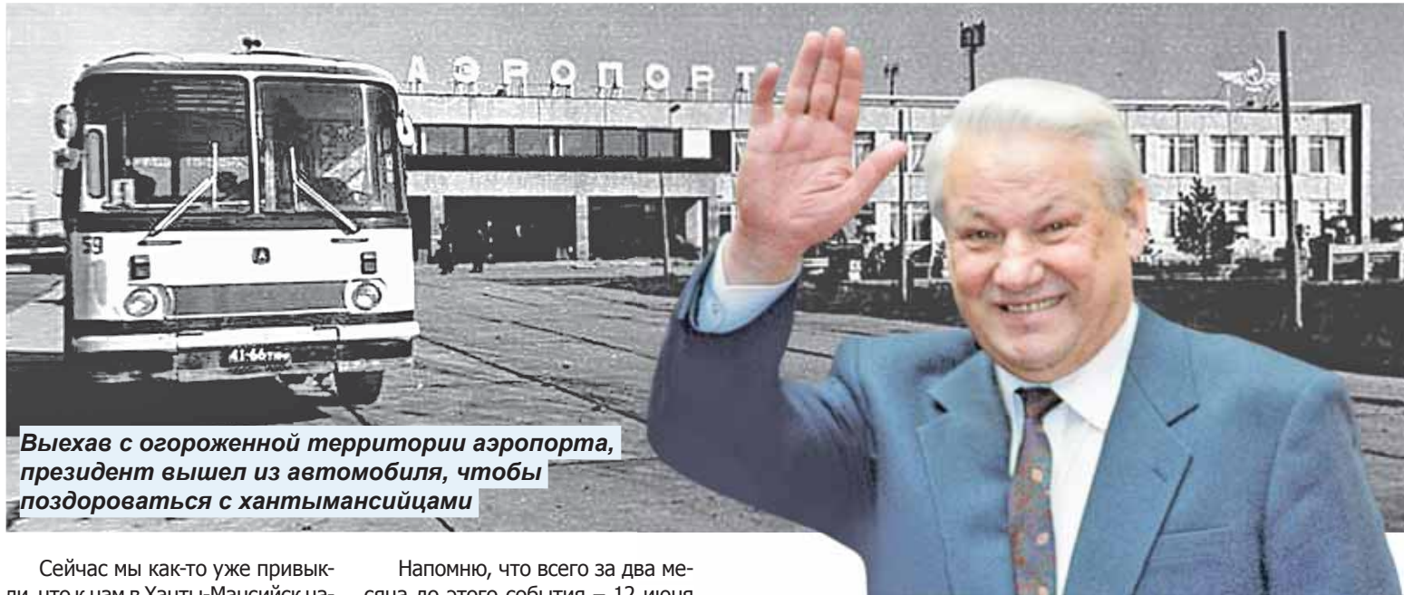
Выехав с огороженной территории аэропорта, президент вышел из автомобиля, чтобы поздороваться с хантымансийцами

Визит в Ханты-Мансийск в августе 1991 года первого Президента России стал событием в жизни Югры