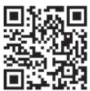
QR-code app store

Желаем в жизни все успеть И не стареть, а молодеть, Здоровье, бодрость сохранить И много-много лет прожить.