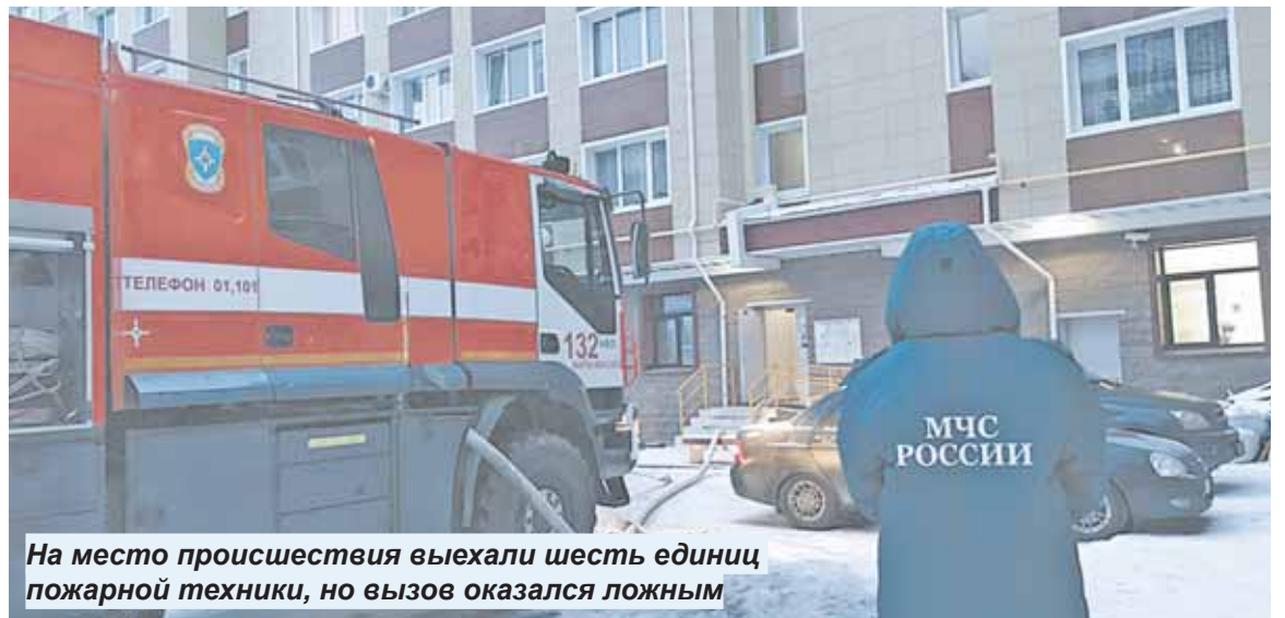
На место происшествия выехали шесть единиц пожарной техники, но вызов оказался ложным

В минувшую среду в 15:36 пожарные Ханты-Мансийска получили несколько сообщений о том, что на ул. Чехова, 19 горит крыша.