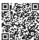
QR-code Google Play

Сервис разработан как личный помощник пользователя и призван содействовать формированию культуры безопасного поведения, как среди взрослого, так и среди подрастающего поколения. Приложение поможет сориентироваться и мгновенно найти информацию о действиях при чрезвычайной ситуации и будет полезно как в быту, так и на отдыхе. В приложении пользователю доступен вызов службы спасения, а также определение геолокации, которой он может поделиться в случае необходимости. В настоящее время разработано шесть рубрик: «Что делать», «МЧС рекомендует», «Первая помощь», «Карта рисков», «Проверь свою готовность», «Проверь свои знания».