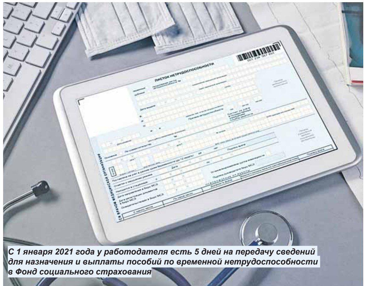
С 1 января 2021 года у работодателя есть 5 дней на передачу сведений для назначения и выплаты пособий по временной нетрудоспособности в Фонд социального страхования

– Для работника практически ничего не поменяется. Как и прежде, нужно предоставлять работодателю стандарт-