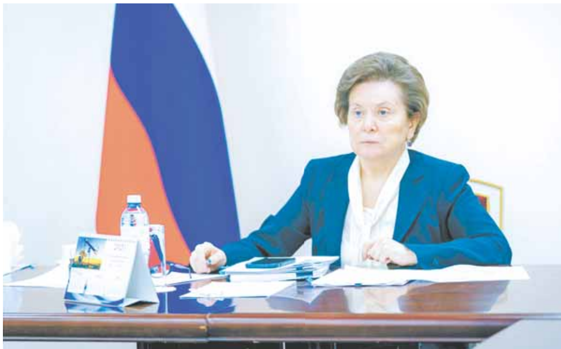
В ходе заседания регионального оперштаба Губернатор Югры Наталья Комарова обратила внимание на бесплатное обеспечение пульсоксиметрами и лекарственными препаратами для лечения COVID-19 граждан в возрасте 60 лет и старше, а также лиц, имеющих хронические заболевания

В отношении работы образовательных организаций Ханты-Мансийска также было отмечено, что с 9 ноября на дистанционный формат обучения переведены 4 526 учеников де-