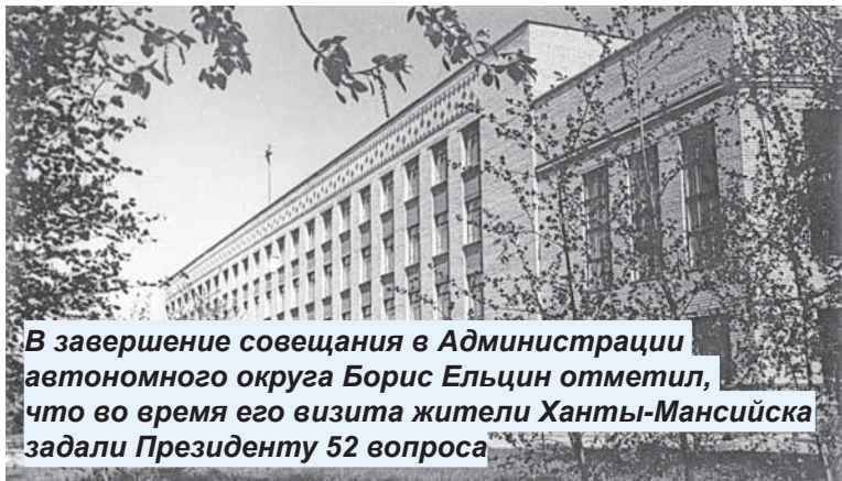
В завершение совещания в Администрации автономного округа Борис Ельцин отметил, что во время его визита жители Ханты-Мансийска задали Президенту 52 вопроса

P.S. А статью с моим отчетом о визите Бориса Ельцина в Ханты-Мансийск тогда отредактировал лично Новомир Борисович, оставив в ней лишь официальную часть.