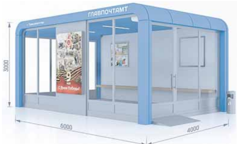
Первые четыре павильона появятся на улицах Мира, Гагарина и Комсомольская

Ход реализации проекта «Умный город» обсудили в Администрации Ханты-Мансийска