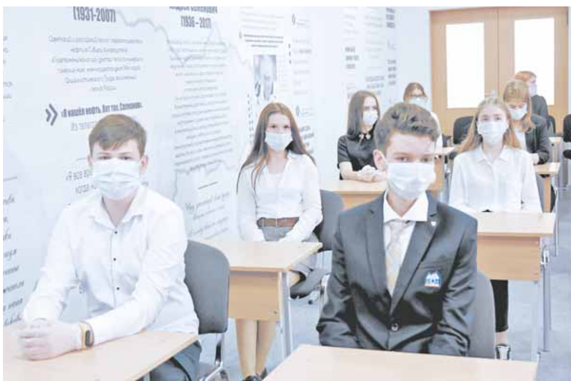
Школьники переведены на «дистанционку». Для учеников 9-11 классов организован смешанный режим обучения

вяти школ города, в том числе 88 – по заявлению родителей. Для 9-11 классов организован смешанный режим обучения. 83 школьника по запросу получили в пользование ноутбуки.