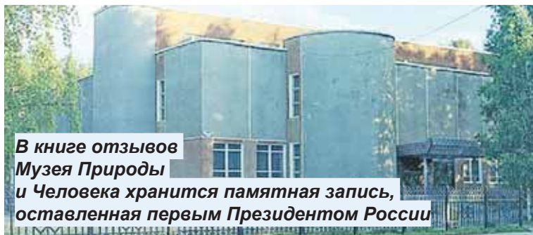
В книге отзывов Музея Природы и Человека хранится памятная записка, оставленная первым Президентом России

Вошел в историю как первый всенародно избранный глава России, радикальный реформатор общественно-политического и экономического устройства России.