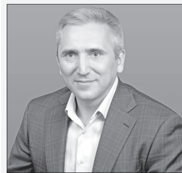
Врио Губернатора Тюменской области Александр Моор:

Тюмень, Ямал и Югра крепко связаны между собой историей, экономикой и человеческими судьбами. Сотрудничество – это образ нашей жизни и взаимоотношений.