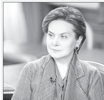
Наталья Комарова, Губернатор Югры:

«Очень важно по прошествии времени оценить востребованность такого формата работы, что позволит сделать соответствующие выводы и внести корректировки. Безусловно, я высоко оцениваю такую площадку для ведения открытого диалога между властями и людьми по очень важным направлениям – жилью и жилищно-коммунальной сфере».