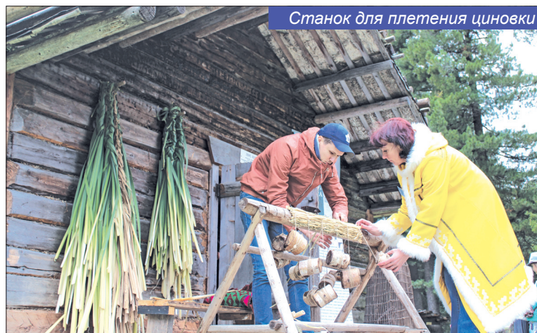
Станок для плетения циновки