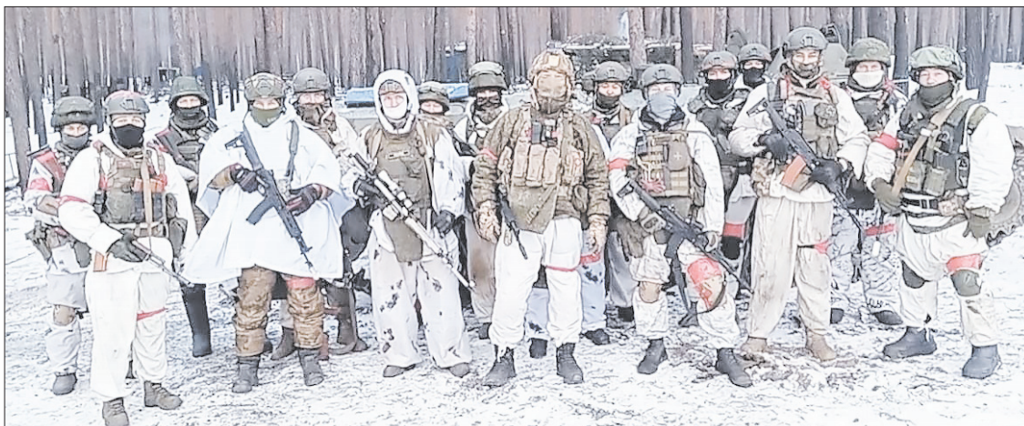
Из наших бойцов ни один человек не попятился назад, не струсил и не сказал, что не пойдет выполнять боевую задачу