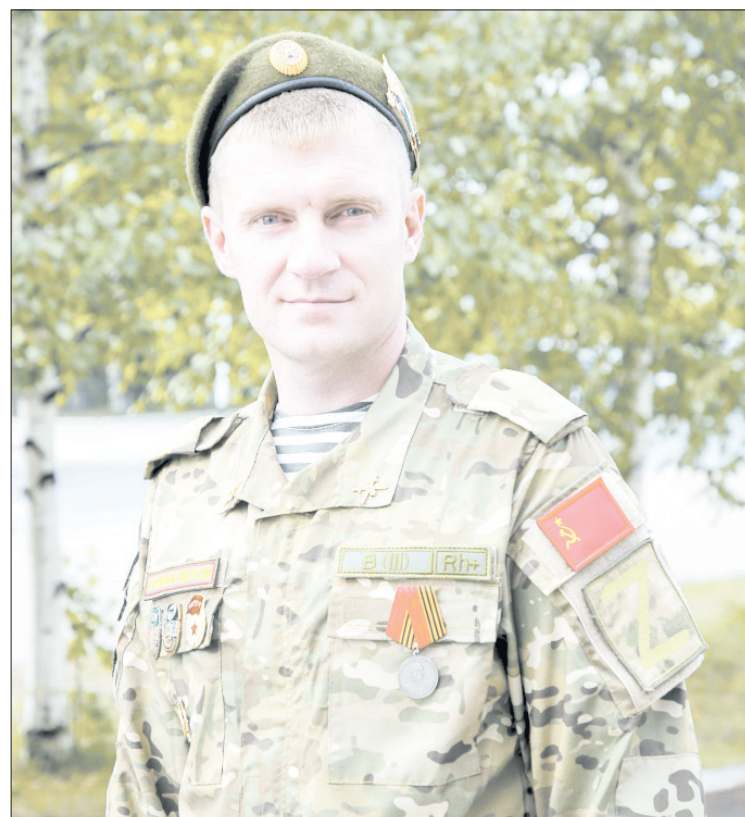
Боец благодарит всех югорчан, которые присылают в зону СВО гуманитарную помощь

«Волк» – большой выдумщик. А природная смекалка, веселый нрав и деревенская деловитость делают его незаменимым в хозяйстве человеком. Под Новый год, например, он срубил сосенку и украсил ее игрушками из подручного ма-