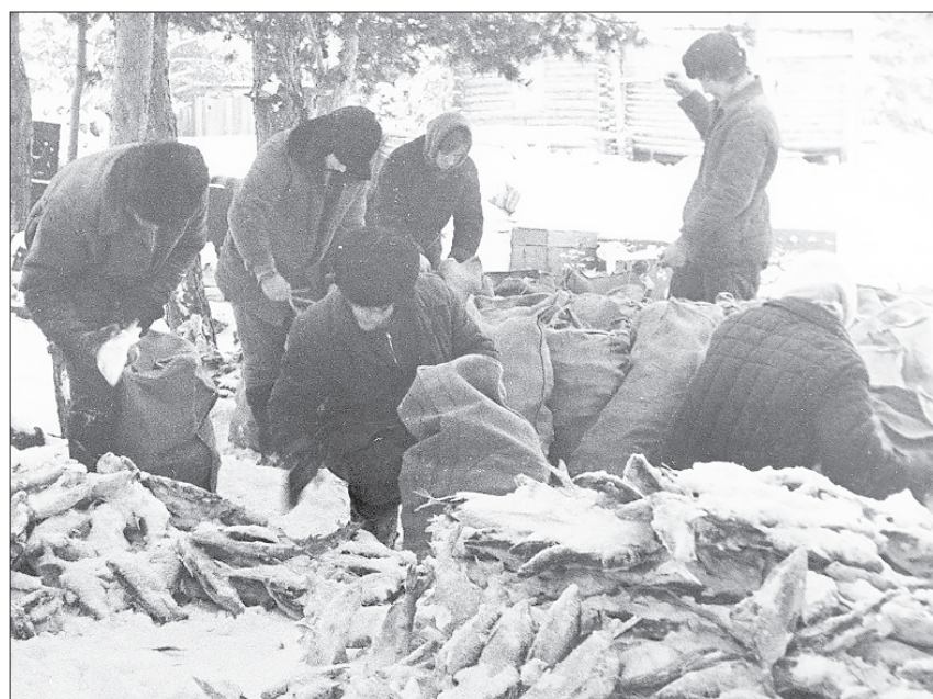
На фото: труженики тыла Ханты-Мансийска в военные годы

Секретарь Генерального совета всероссийской политической Партии «ЕДИНАЯ РОССИЯ» Андрей Анатольевич Турчак поддержал ходатайство Думы Югры о присвоении Ханты-Мансийску почетного звания «Город трудовой доблести».