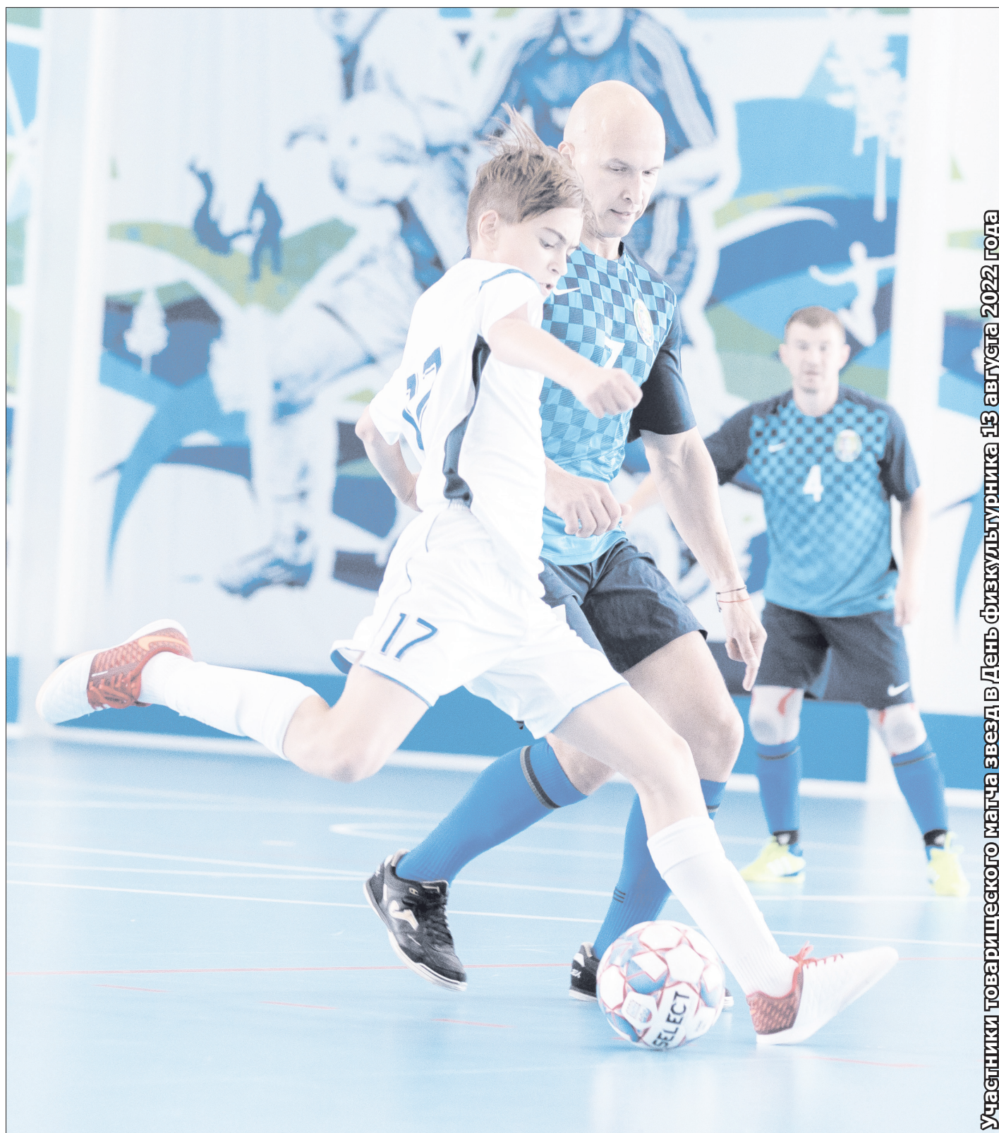
Участники товарищеского матча звезд в День физкультурника 13 августа 2022 года