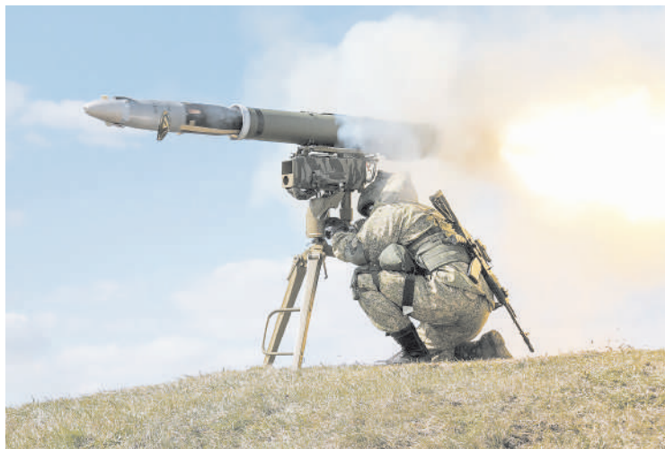
Мы санитары. Мы должны вырезать эту болевую точку