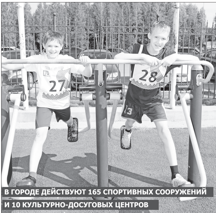
В ГОРОДЕ ДЕЙСТВУЮТ 165 СПОРТИВНЫХ СООРУЖЕНИЙ И 10 КУЛЬТУРНО-ДОСУГОВЫХ ЦЕНТРОВ

На состоявшемся на прошлой неделе заседании Антинаркотической комиссии принято решение о необходимости продолжения масштабной профилактической работы среди населения, в особенности детей и молодежи, поскольку во многом благодаря организации активного отдыха и занятий спортом горожан удалось снизить количество людей, страдающих наркоманией, на 41,3%.