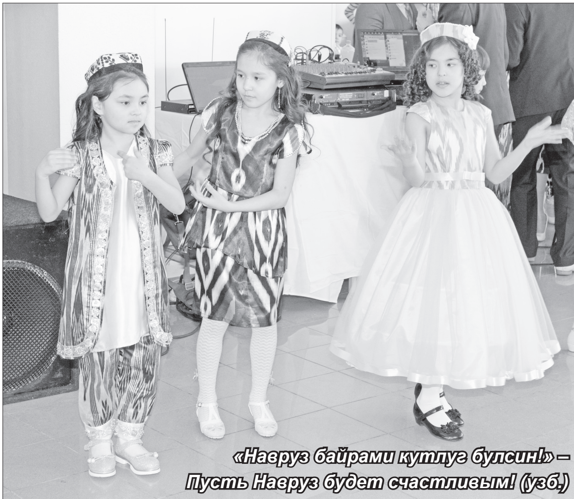
«Навруз байрами кутлуг булсин!» – Пусть Навруз будет счастливым! (узб.)