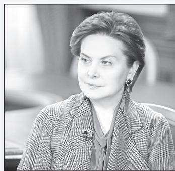
Наталья Комарова, Губернатор Югры:

«Мы благодарим ФИДЕ и Российскую шахматную федерацию за оказанное высокое доверие и выбор, сделанный в пользу Ханты-Мансийска как города 44-й Всемирной шахматной олимпиады. В 2020 году на Олимпиаде в Ханты-Мансийске мы обеспечим все стандарты ФИДЕ и, надеюсь, сделаем эту работу чуть-чуть лучше, чем Батуми».