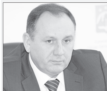
Максим Ряшин, Глава Ханты-Мансийска:

«Нашей приоритетной задачей было избавиться от многоквартирных деревянных домов с печным отоплением. Этот план мы выполнили с опережением. На сегодняшний день в Ханты-Мансийске не осталось двухэтажных домов с печным отоплением».