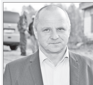
Теодор Марютин, заместитель Главы Ханты-Мансийска:

«Главная цель – чтобы наш город был чистым. И ситуация, когда собственники земельных участков считают, что достаточно частично вывести мусор, а остальное засыпать грунтом, недопустима и противоречит действующему законодательству в части утилизации твердых коммунальных отходов».