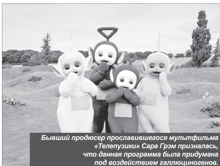
Бывший продюсер прославившегося мультфильма «Телепузики» Сара Грэм призналась, что данная программа была придумана под воздействием галлюциногенов.

Наконец, нельзя отметить в сторону тот факт, что киноискусство развивается, вбирает в себя те технологии, которые дарит время. Согласитесь, что компьютерная графика сильно изменила и наш мир, и часть этого мира — искусство, в том числе кино и мультфильмы.