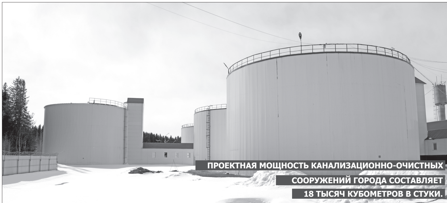
ПРОЕКТНАЯ МОЩНОСТЬ КАНАЛИЗАЦИОННО-ОЧИСТНЫХ СООРУЖЕНИЙ ГОРОДА СОСТАВЛЯЕТ 18 ТЫСЯЧ КУБОМЕТРОВ В СУТКИ.

18 ТЫСЯЧ КУБОМЕТРОВ В СУТКИ - ПРОЕКТНАЯ МОЩНОСТЬ КАНАЛИЗАЦИОННО- ОЧИСТНЫХ СООРУЖЕНИЙ ГОРОДА, ФАКТИЧЕСКИ ЖЕ В МАРТЕ ТЕКУЩЕГО ГОДА СБРАСЫВАЛИСЬ 14 ТЫСЯЧ КУБОМЕТРОВ В СУТКИ 16 ОСНОВНЫХ ПОКАЗАТЕЛЕЙ КАЧЕСТВА СБРАСЫВАЕМЫХ СТОЧНЫХ ВОД КОС ГОРОДА, ПО КОТОРЫМ ОЦЕНИВАЮТСЯ ПРОБЫ