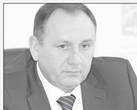
Максим Ряшин, Глава города Ханты-Мансийска:

«В целях обеспечения безопасности на дорогах в муниципалитете разработана и утверждена комплексная схема организации дорожного движения, которая позволит снизить уровень аварийности на дорогах и равномерно распределить транспортные потоки в черте города».