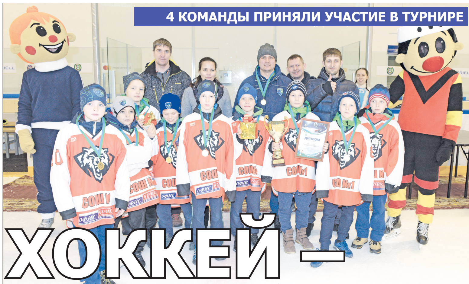
4 КОМАНДЫ ПРИНЯЛИ УЧАСТИЕ В ТУРНИРЕ

С 14 по 15 апреля в Ледовом дворце спорта прошел открытый городской турнир по хоккею на призы Администрации Ханты-Мансийска. В нем приняли участие четыре команды – сборные коллективы школ. На льду они показали, что могут соревноваться не только в знании учебных дисциплин, но и во владении шайбой.