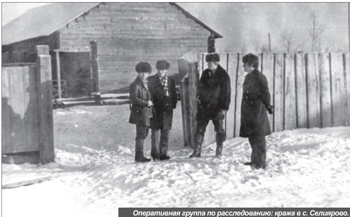
Оперативная группа по расследованию: кража в с. Селиярово.