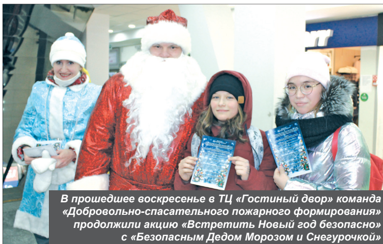
В прошедшее воскресенье в ТЦ «Гостиный двор» команда «Добровольно-спасательного пожарного формирования» продолжили акцию «Встретить Новый год безопасно» с «Безопасным Дедом Морозом и Снегурочкой»

- Зарегистрированы на сегодня 50 участников, это люди, у кото-