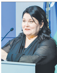
Наталья Западная, заместитель председателя Думы ХМАО-Югры:

- Показатели социально-экономического развития муниципалитета подтверждают планомерность в решении задач, поставленных Президентом России и Губернатором Югры. Очень приятно, что Ханты-Мансийск все чаще звучит на федеральном уровне, становясь пилотной площадкой для реализации различных проектов. Результаты деятельности Главы муниципалитета и органов местного самоуправления говорят о том, что они действуют как единый, слаженный механизм. Благодаря чему город успешно справляется с поставленными задачами.