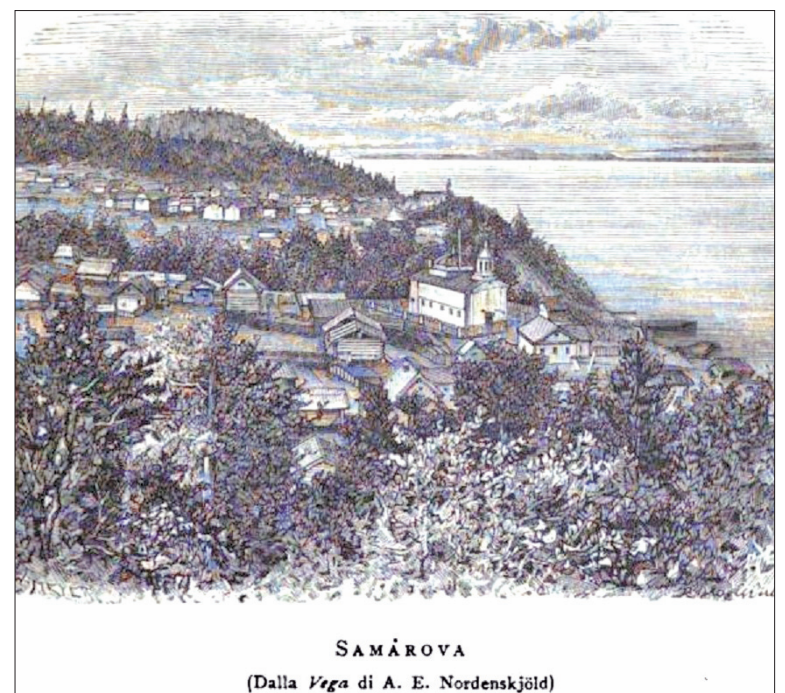
SAMAROVA (Dalla Vega di A. E. Nordenskjöld)