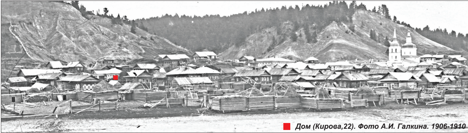
■ Дом (Кирова, 22). 1906-1910