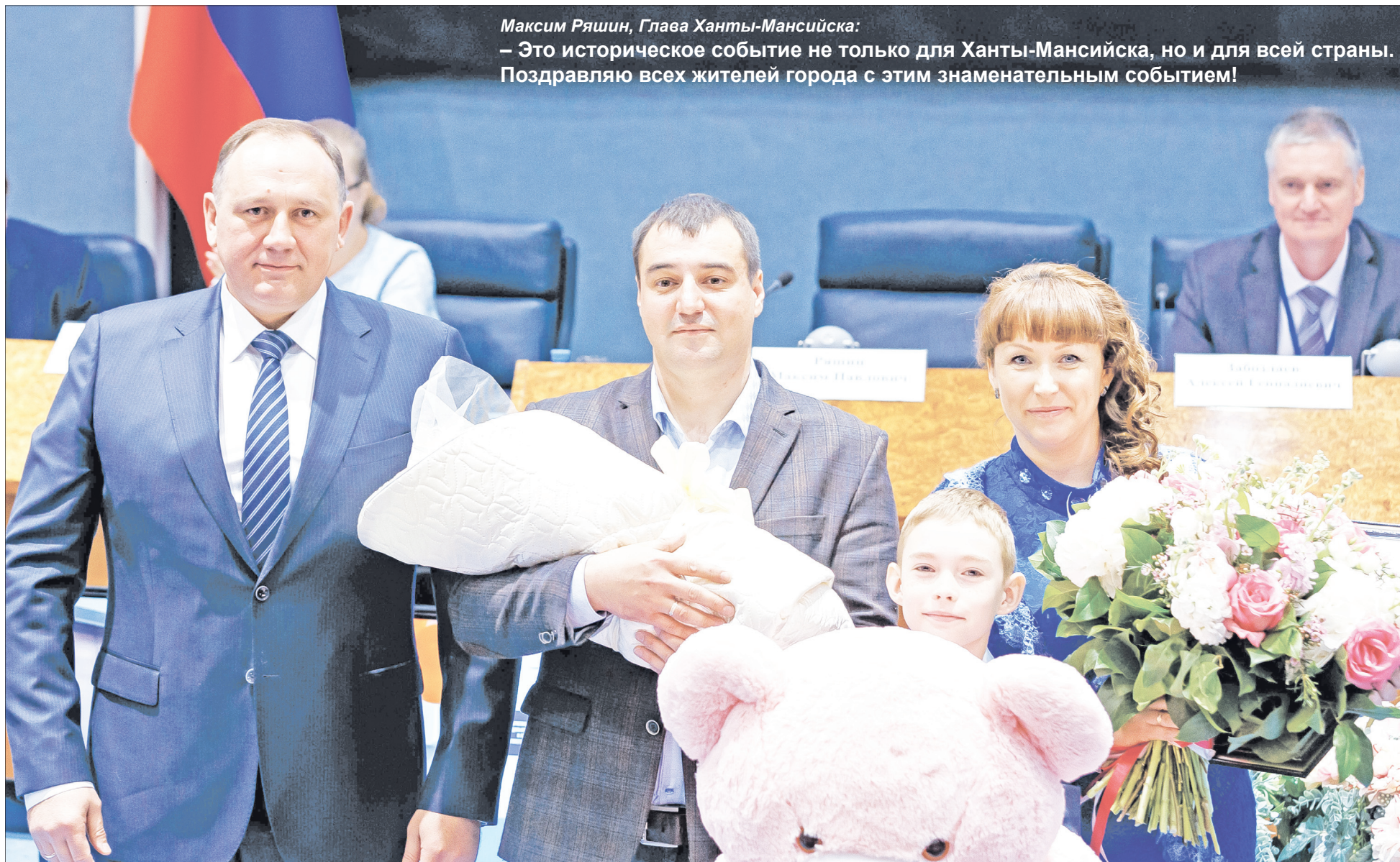
Максим Ряшин, Глава Ханты-Мансийска:

№26 (1078) 20 ИЮНЯ 2019 ГОДА | ИЗДАЕТСЯ С 16.12.1998Г. | ВЫХОДИТ ПО ЧЕТВЕРГАМ | ЦЕНА В РОЗНИЦУ СВОБОДНАЯ