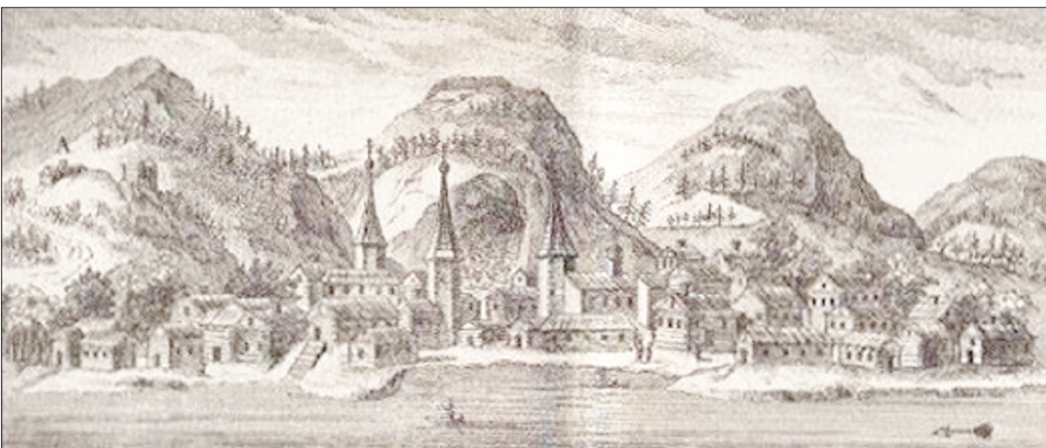
Ил. 6. Самаровский ям. Гравюра: Т. Кёнигсфельс (1740 г.). (Фрагмент)