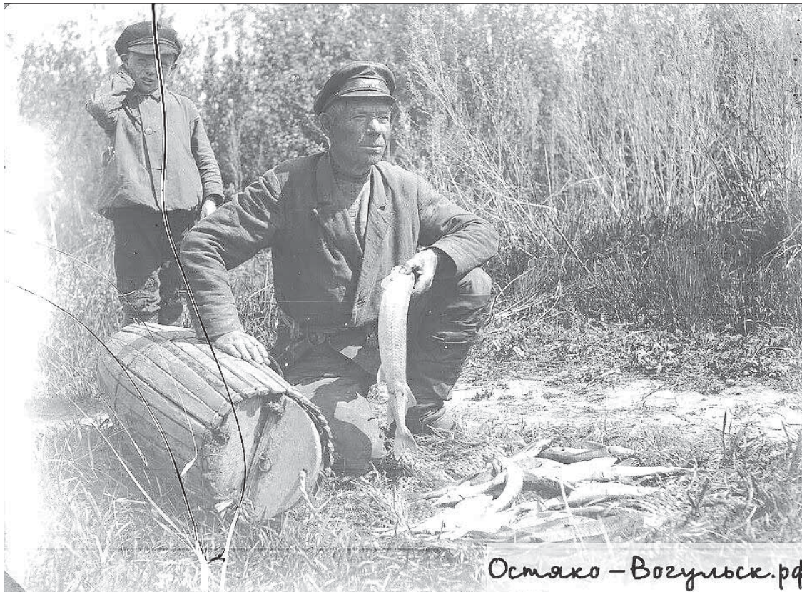
Остяко – Возульск. рф