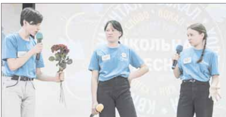
Выступления команд КВН стали гвоздем программы творческого квартирника «Школьная весна»

В ЭТОМ ГОДУ К ФЕСТИВАЛЮ ПРИСОЕДИНИЛОСЬ ЕЩЕ ОДНО ГОСУДАРСТВО – «ОМЕГА», ПРЕДСТАВИВШЕЕ НОВУЮ ОБЩЕОБРАЗОВАТЕЛЬНУЮ ШКОЛУ № 9