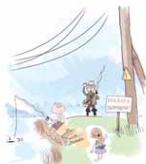
ОПАСНО РЫБАЧИТЬ ПОД ЛИНИЯМИ ЭЛЕКТРОПЕРЕДАЧИ