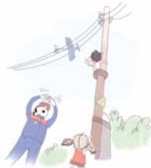
ОПАСНО ИГРАТЬ ВБЛИЗИ ЛИНИЙ ЭЛЕКТРОПЕРЕДАЧ