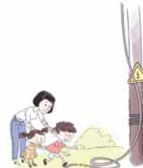
ОПАСНО ПРИБЛИЖАТЬСЯ К ОБОРВАННОМУ ПРОВОДУ