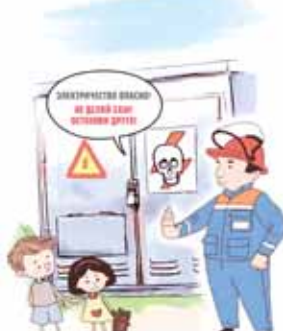
ОПАСНО ВЛЕЗАТЬ В ТРАНСФОРМАТОРНЫЕ БУДКИ