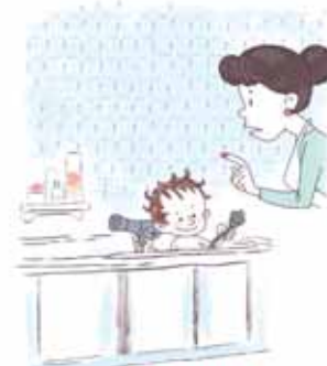
ОПАСНО ПРИКАСАТЬСЯ К ЭЛЕКТРОПРИБОРАМ МОКРЫМИ РУКАМИ