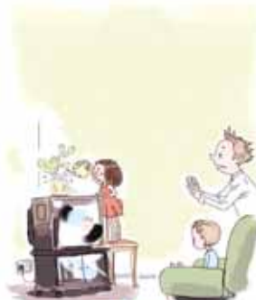
ОПАСНО ИСПОЛЬЗОВАТЬ ЭЛЕКТРОПРИБОРЫ РЯДОМ С ВОДОЙ