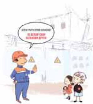
ОПАСНО ЗАЛЕЗАТЬ НА ЭНЕРГООБЪЕКТЫ. ЕСЛИ ЗАОРИТСЯ ЭЛЕКТРОПРИБОР, ЗВОНИ 101!