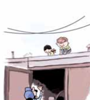
ОПАСНО ИГРАТЬ ВБЛИЗИ ПРОВОДОВ