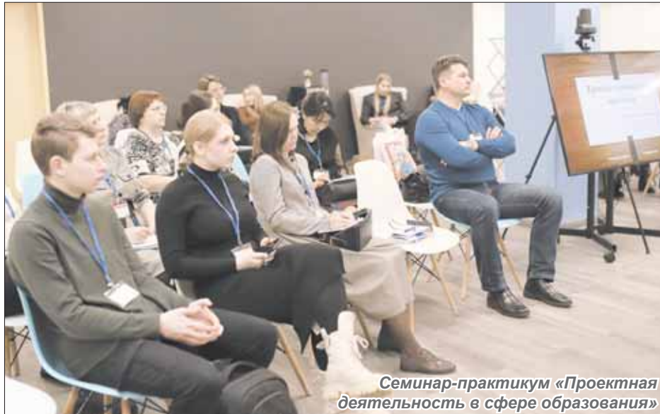
Семинар-практикум «Проектная деятельность в сфере образования»