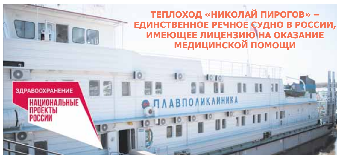
ТЕПЛОХОД «НИКОЛАЙ ПИРОГОВ» – ЕДИНСТВЕННОЕ РЕЧНОЕ СУДНО В РОССИИ, ИМЕЮЩЕЕ ЛИЦЕНЗИЮ НА ОКАЗАНИЕ МЕДИЦИНСКОЙ ПОМОЩИ

Для специалистов на теплоходе созданы все условия для комфортного проживания. В свободное от работы время персонал может зани-