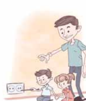
ОПАСНО ИГРАТЬ С ЭЛЕКТРИЧЕСКИМИ РОЗЕТКАМИ