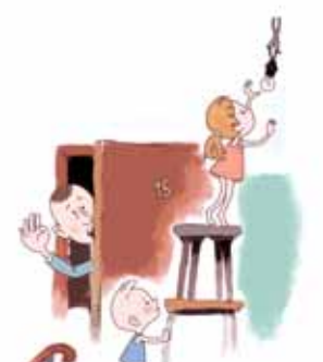
ОПАСНО САМОСТОЯТЕЛЬНО РЕМОНТИРОВАТЬ ПРИБОРЫ