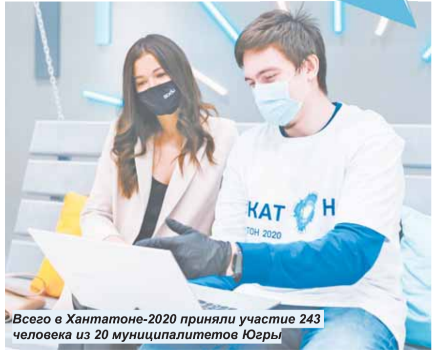
Всего в Хантатоне-2020 приняли участие 243 человека из 20 муниципалитетов Югры

– В этом году призовой фонд составил 500 тыс. рублей. Но он предназначался только для победителей в номина-