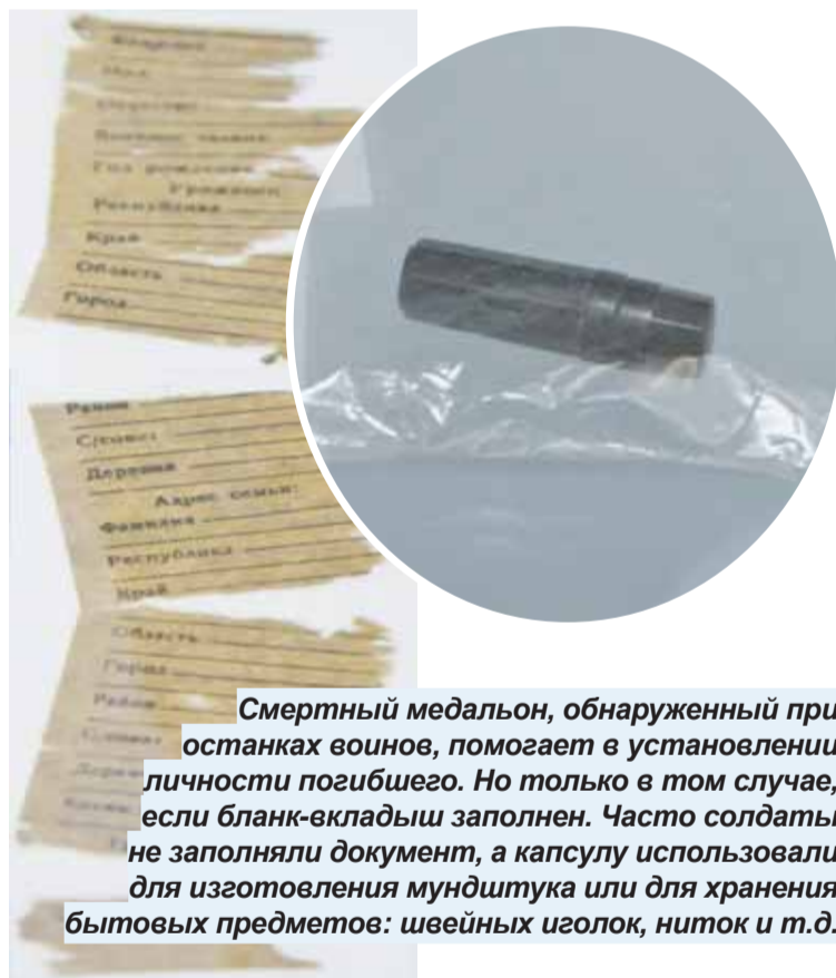
Смертный медальон, обнаруженный при останках воинов, помогает в установлении личности погибшего. Но только в том случае, если бланк-вкладыш заполнен. Часто солдаты не заполняли документ, а капсулу использовали для изготовления мундштука или для хранения бытовых предметов: швейных иголок, ниток и т.д.

Из этой поездки отряд привез экспонаты, которые пополнили музей школы №1. Например, мундштук, пробку от фляги. При раскопках был найден и немецкий ботинок, который отлично сохранился.