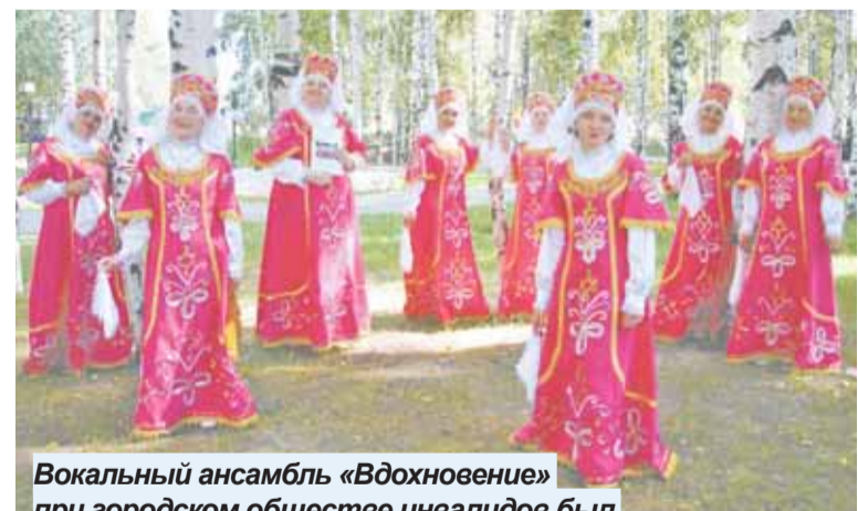
Вокальный ансамбль «Вдохновение» при городском обществе инвалидов был создан шесть лет назад

Более сорока лет она преподавала в школах. Перенесла тяжелое заболевание, несколько операций, длительное лечение, нашла в себе силы собрать