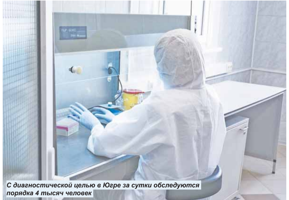
С диагностической целью в Югре за сутки обследуются порядка 4 тысяч человек

Кроме того, за два дня до взятия мазка рекомендуется отказаться от употребления спиртных напитков.