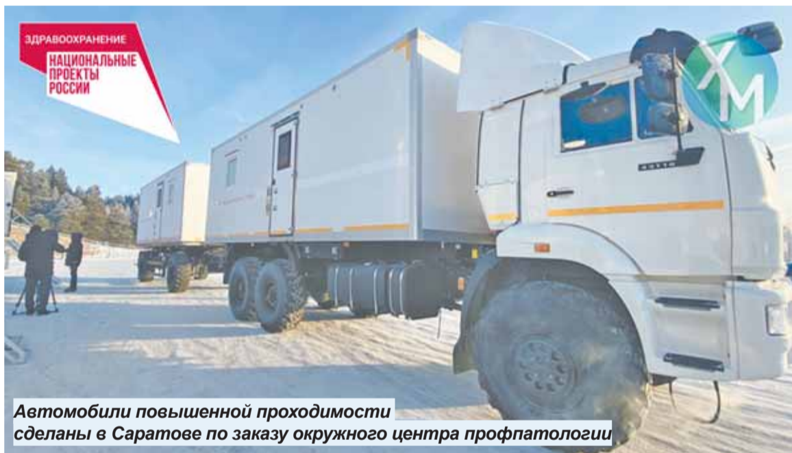
Автомобили повышенной проходимости сделаны в Саратове по заказу окружного центра профпатологии

Автопарк окружного центра профессиональной патологии пополнился медицинской техникой повышенной проходимости.