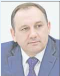
Максим Ряшин, Глава г. Ханты-Мансийск:

– Подготовить первый добровольный национальный обзор хода осуществления повестки дня в области устойчивого развития на период до 2030 года.