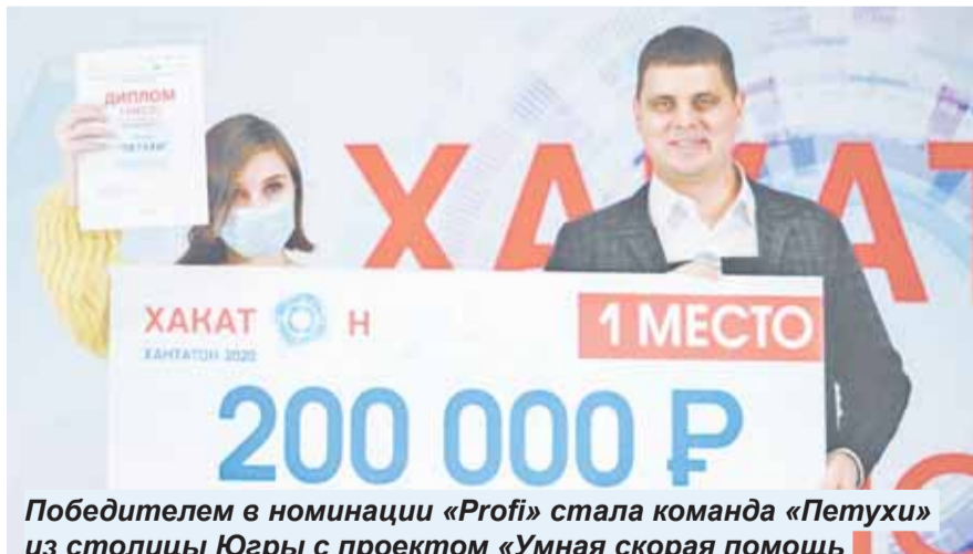
Победителем в номинации «Profi» стала команда «Петухи» из столицы Югры с проектом «Умная скорая помощь в Югре». В номинации «Junior» лучшими стали тоже хантымансийцы – команда «S.H&K.K». Они представили приложение-квест для смартфона «КО.МАР»